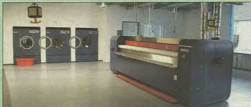
In der Wäscherei werden alle Arbeiten von Mitarbeitern mit geistiger Behinderung verrichtet.